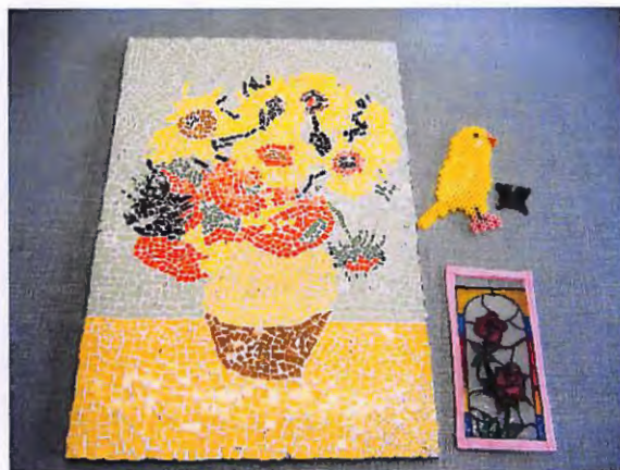
合同作品・個人作品