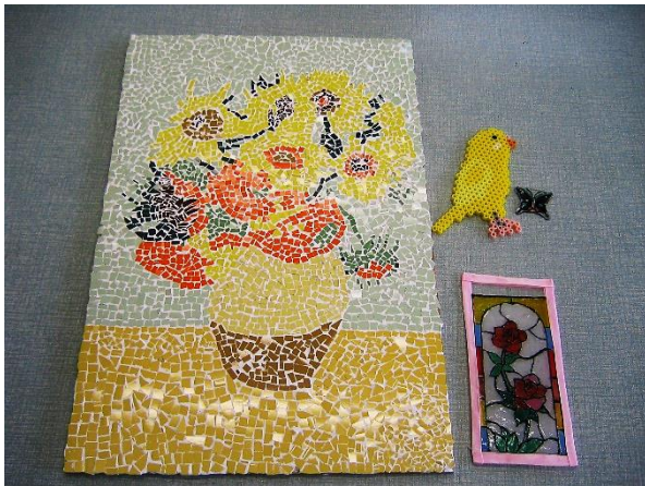
合同作品・個人作品